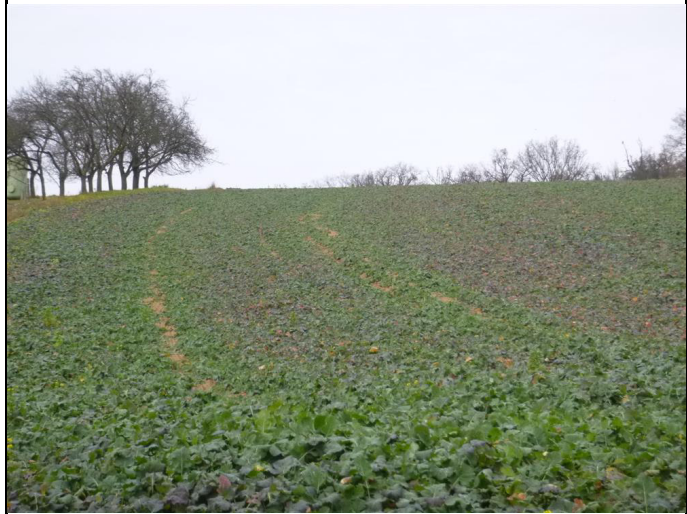
Pozemek p.č. 2125