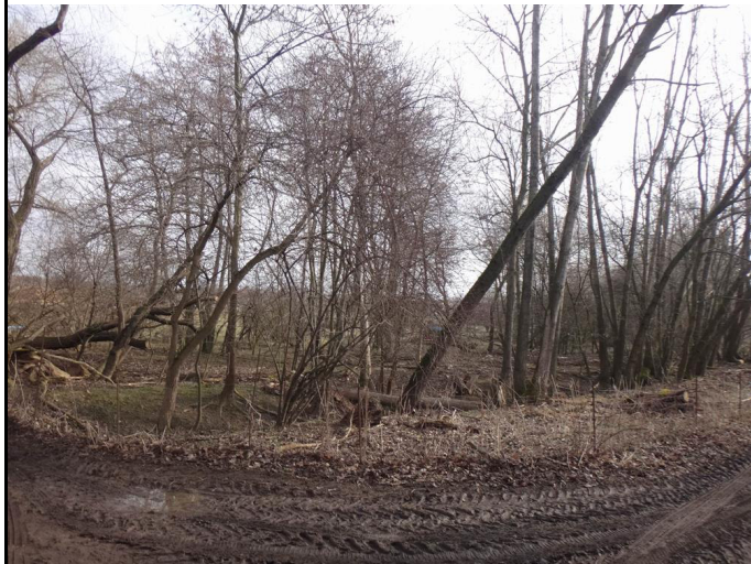
Pozemky p.č. 1452 a p.č. 1453