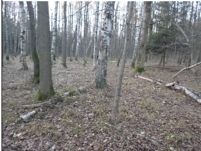
Pozemek p.č. 496