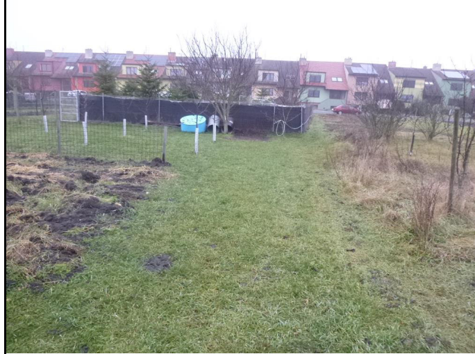
pozemek p.č. 221/1