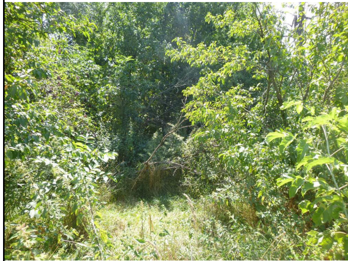
Pozemek p.č. 928/2