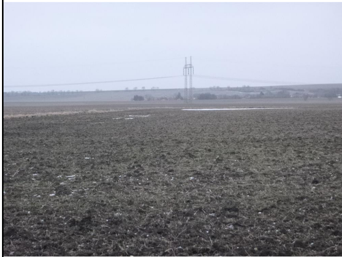
pozemek p.č. 3201 (LV č. 577)