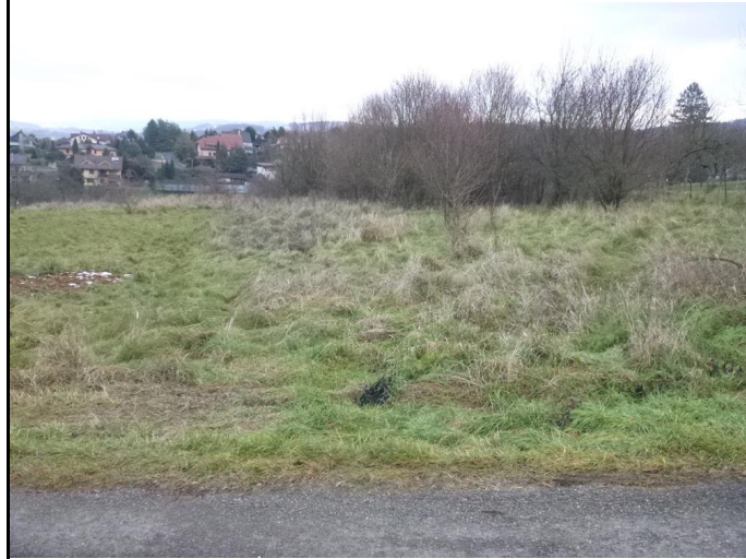
pozemek p.č. 381/3