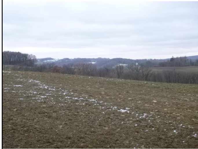
pozemek p.č. 748/88