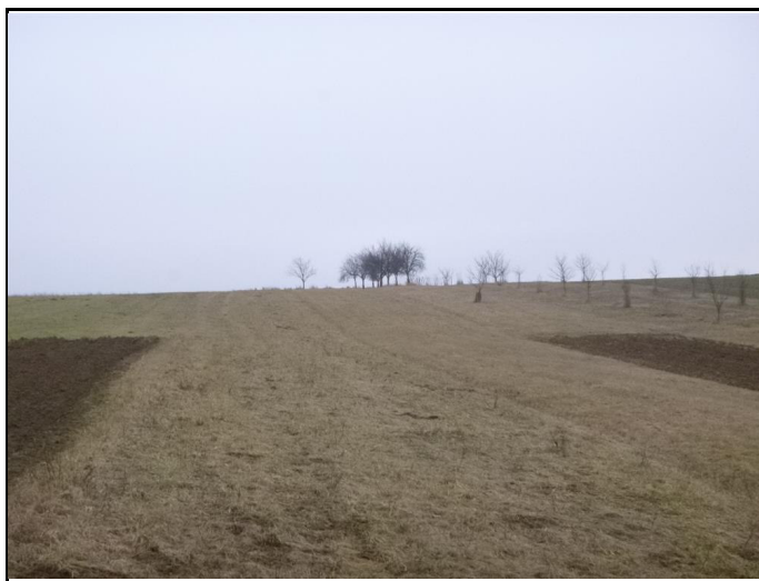
Pozemky k.ú. Syrovín, LV č. 183