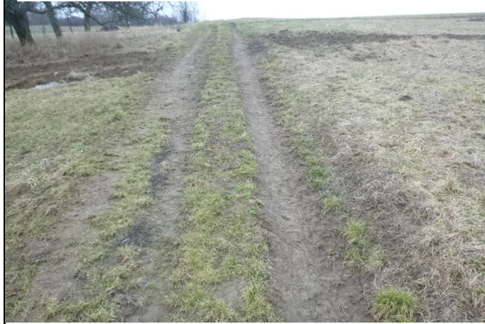
Pozemky k.ú. Žeravice u Kyjova, LV č. 1231