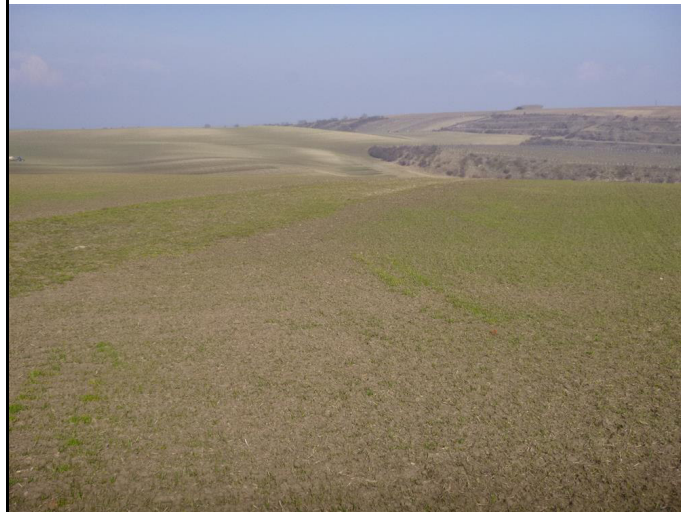
pozemek p.č. 1769/4